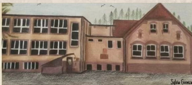
Obraz narysowany przez absolwentkę szkoły Sylwię Giezmę