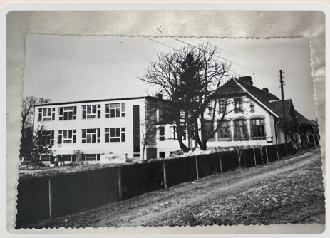
Widok na szkołę w roku 1964