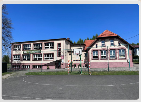
Widok na szkołę w roku 2023