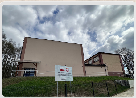
Nowo wybudowana sala gimnastyczna - 2023 r.